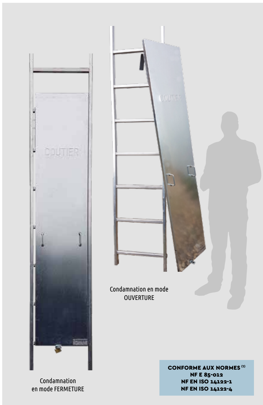
Condamnation en mode OUVERTURE